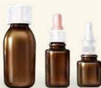
líquido en frascos, goteros o vaporizadores